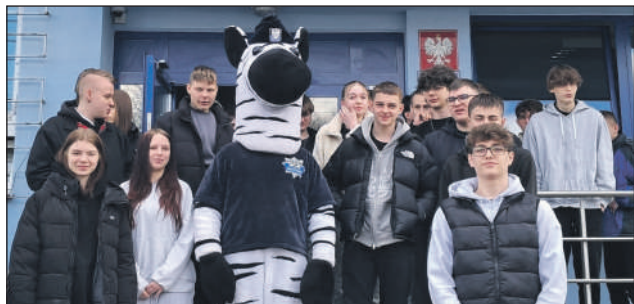
Z policyjną maskotką przy wejściu na policję

Radiowozy, sprzęt i słynny Mustang z drogówki. Uczniowie Zespołu Szkół im. KOP w Szydłowcu odwiedzili Komendę Powiatowej Policji w Szydłowcu i sprawdzili, jak naprawdę wygląda służba w Policji.