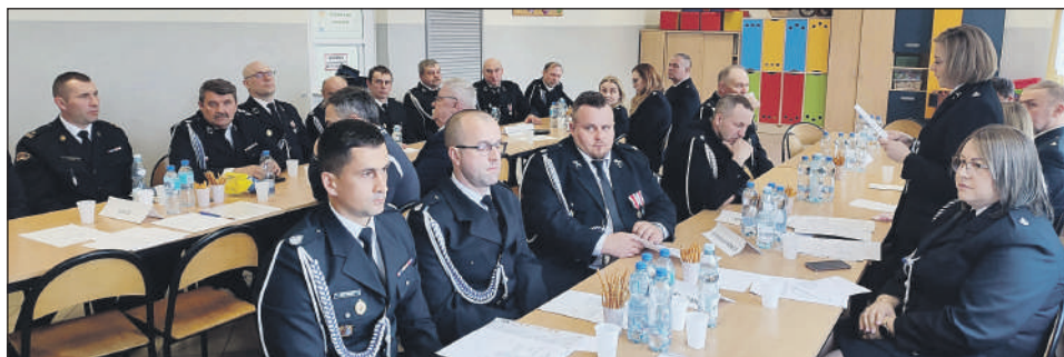
Uczestnicy zjazdu podczas obrad

W sobotę, 11 kwietnia 2026 roku, w Chlewiskach odbył się Zjazd Oddziału Gminnego Związku OSP RP. Spotkanie było okazją do podsumowań, podziękowań, ale też wyboru nowych władz na kolejną kadencję.