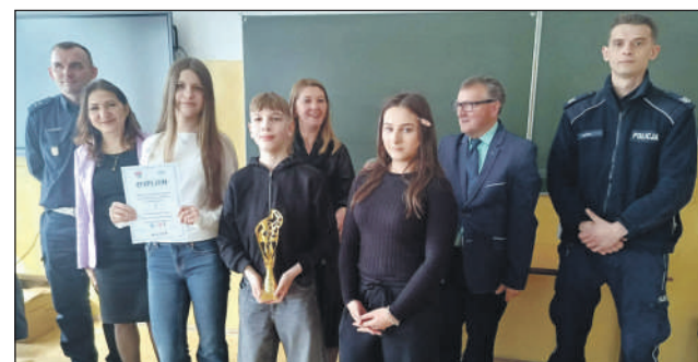
Nagrodzeni ze starszej grupy