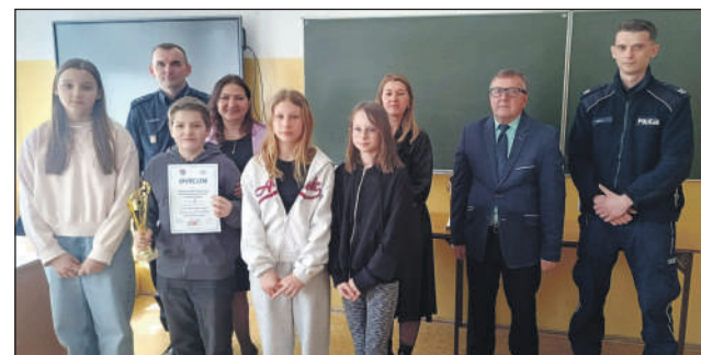
Laureaci z młodszej grupy

Świetne wiadomości ze Zbijowa Małego! Uczniowie Zespołu Szkolno-Przedszkolnego wrócili z Ogólnopolskiego Turnieju Bezpieczeństwa w Ruchu Drogowym z dwoma drugimi miejscami.