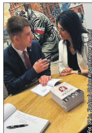
Listopadowe spotkanie autorskie

Brawa za wsparcie i wkład w rozwój wiedzy o historii