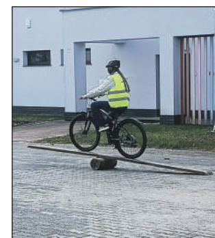
Jedna z konkurencji