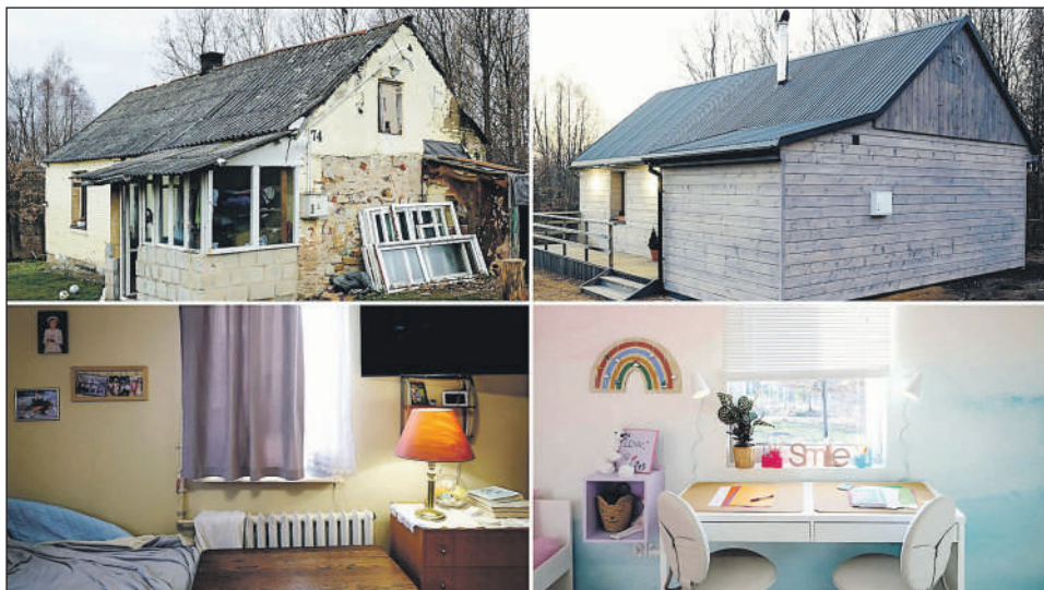
Spektakularne efekty pracy ekipy Polsatu.

Program „Nasz nowy dom” po raz kolejny udowodnił, że Telewizja Polsat nie tylko dostarcza rozrywki, ale przede wszystkim wyciąga pomocną dłoń do tych, którzy najbardziej tego potrzebują. Radość i łzy szczęścia rodziny z Woli Korzeniowej to najpiękniejsza recenzja tego odcinka. Cieszymy się, że nasi sąsiedzi mogą teraz patrzeć w przyszłość z uśmiechem i spokojem. Brawo Polsat!