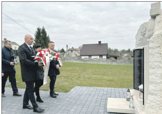
Delegacja UG Chlewiska

Uroczystości przebiegały w atmosferze ciszy i zadumy. Wspominano mieszkańców Skłobów i Stefankowa, którzy zginęli w wyniku brutalnej pacyfikacji. Ich