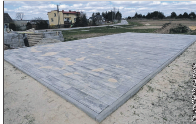
Mocne podstawy pod altanę...

W realizację przedsięwzięcia zaangażowały się podmioty zewnętrzne i lokalna społeczność. Materiały budowlane dostarczyła firma Jadar Sp. z o.o., oferując je na preferencyjnych warunkach.