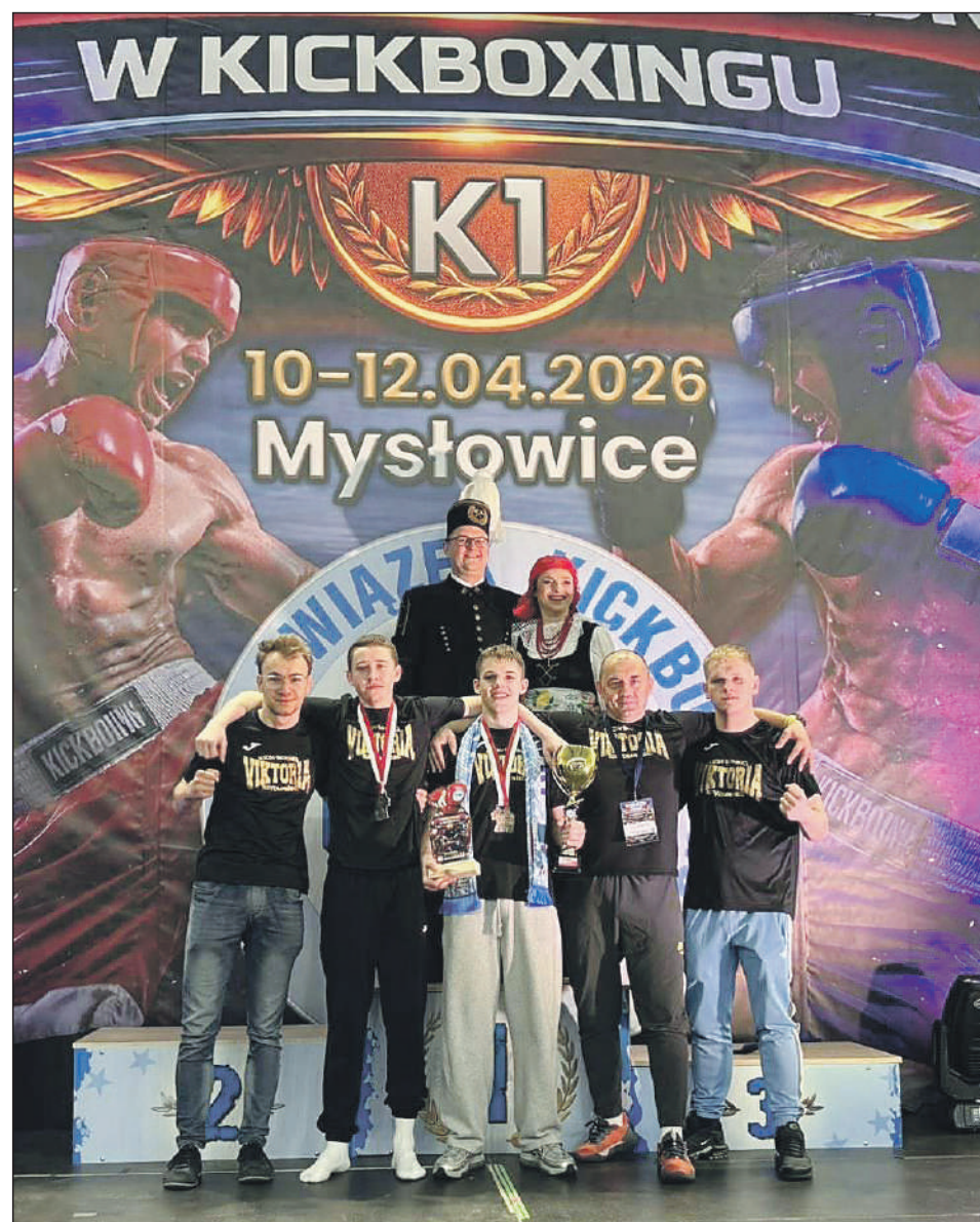
JJ Nasi z radością pozują po zawodach

To kolejny dowód na to, że w Szydłowcu rosną naprawdę mocni zawodnicy!