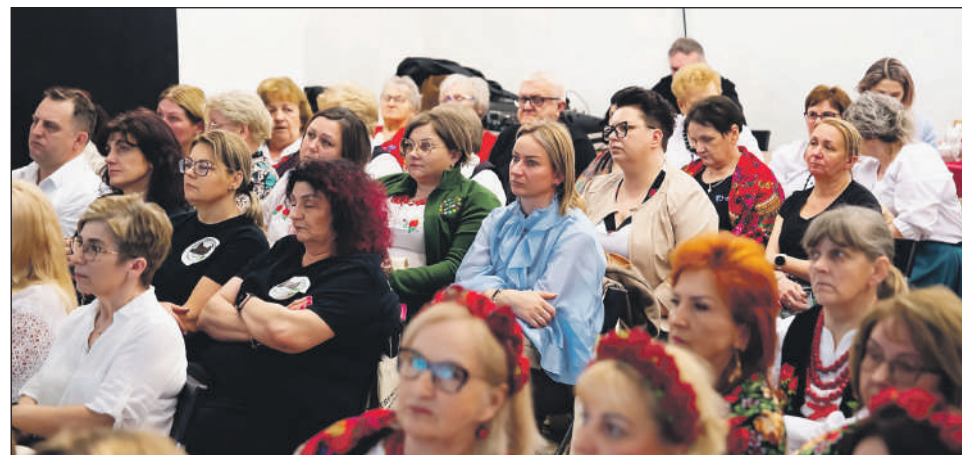
Część uczestniczek i uczestników konferencji

- Współpraca samorządów z kołami gospodyń wiejskich to inwestycja w ludzi i rozwój lokalnych społeczności. Stale odwiedzam radomskie wsie i widzę, że z roku na rok dzięki wsparciu samorządu koła mają lepsze warunki do działania – mówił wicemarszałek Rafał Rajkowski.