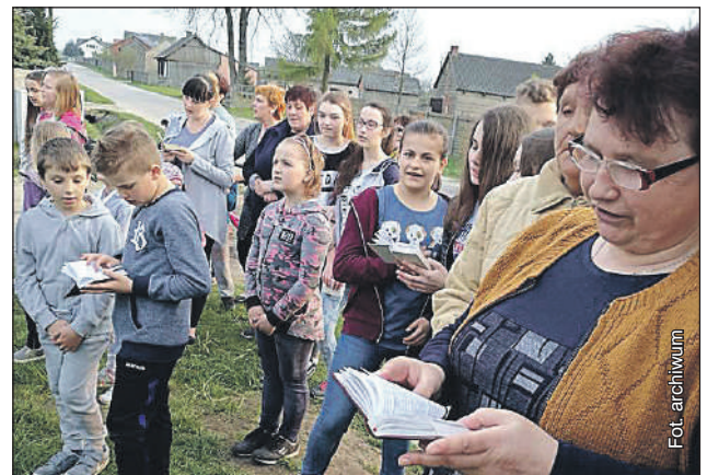
Dzieci, młodzież i dorośli na majówce