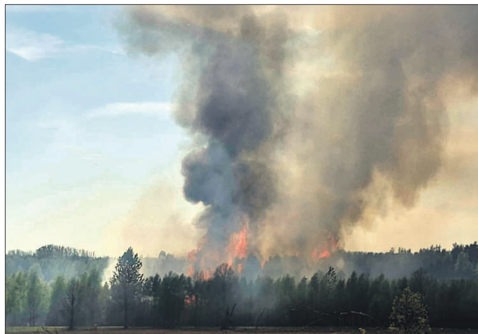
Pożar wierzchołkowy młodnika - ogień przenosił się błyskawicznie górną partią drzew

3 maja ogień pojawił się przy drodze serwisowej między Orońskiem a Dobrutem. Pożar rozwijał