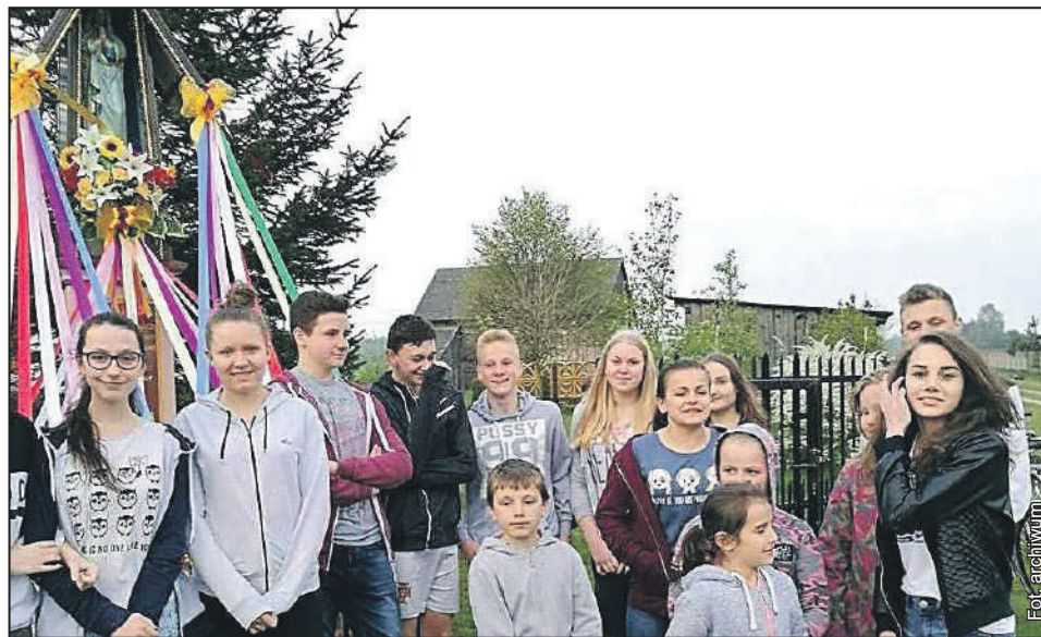
W maju kapliczka jest umajona kwiatami i wstążeczkami

Do Polski nabożeństwo majowe trafiło w pierwszej połowie XIX wieku. Pierwsze oficjalne odprawiono w 1838 roku u jezuitów w Tarnopolu, a niedługo potem, w 1852