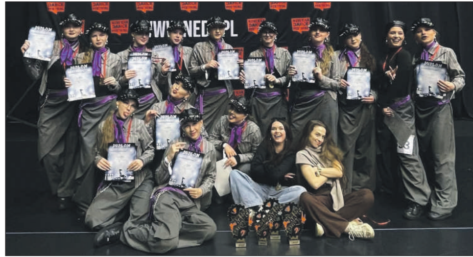
Najwyższy stopień podium!

To był wyjątkowo udany weekend dla reprezentantek szkoły House of Dance Szydłowiec. Podczas turnieju New Era Dance Festival, który odbył się w dniach 9–10 maja w Zabrzu, tancerki wielokrotnie stały na podium, prezentując energię, precyzję i świetne przygotowanie. Najwyższe miejsca wywalczyły dwie formacje. Złoto zdobyła formacja HOD Senior Crew w kategorii Street Dance Formacje 17+