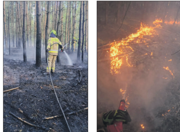
Wszystko w rękach strażaków...

i północnej części województwa świętokrzyskiego.