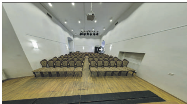
Sala Kameralna w Zamku

Zabytki to nie tylko mury, ale przede wszystkim nasza tożsamość i pamięć zapisana w kamieniu. Sejmik Województwa Mazowieckiego rozstrzygnął kolejną edycję programu „Mazowsze dla zabytków”, przyznając łącznie 13,3 mln zł na ratowanie 138 historycznych obiektów w całym regionie.