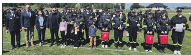
Młodzież została doceniona!

Zawody zorganizował Zarząd Oddziału Powiatowego ZOSP RP wraz z KP PSP w Szydłowcu. Do walki stanęło 10 ekip męskich oraz 2 kobiece. Strażacy musieli wykazać się szybkością i precyzją w sztafecie