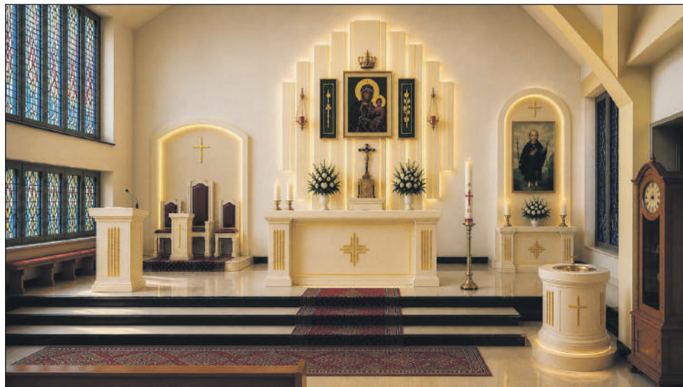
Wizualizacja przedstawiona przez ks. Proboszcza

Wierni natychmiast docenili ten kierunek, a w dyskusji na profilu społecznościowym parafii pojawiła się lawina komentarzy pełnych ciepłych słów. Internauci zgodnie podkreślają, że nowa aranżacja wygląda wyjątkowo przejrzysto i wprowadza do wnętrza cudowne rozjaśnienie. Dominującym hasłem w całej dyskusji stało się słowo „Pięknie!” - powtarzane niemal przez wszystkich komentujących, którzy nie kryją radości na myśl o odnowionym kościele.