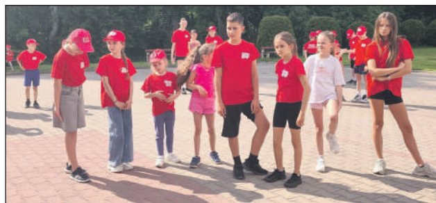
Dzieci gotowe na wykonywanie strażackiej pracy...