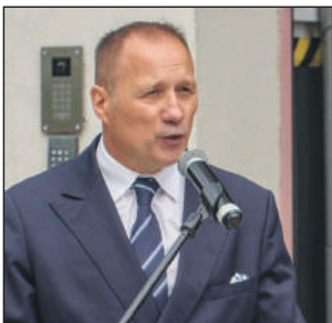
Artur Ludew, burmistrz Szydłowca