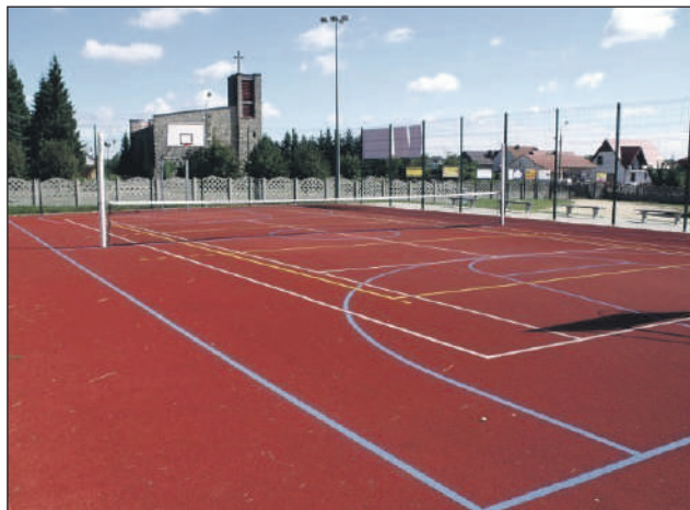
Orlik w Orońsku

Lokalny obiekt sportowy zyska nowy blask dzięki dotacjom z dwóch źródeł. Gmina Orońsko sfinalizowała formalności związane z pozyskaniem funduszy zewnętrznych na ten cel. Łączna kwota wsparcia wynosi 218 560 zł.