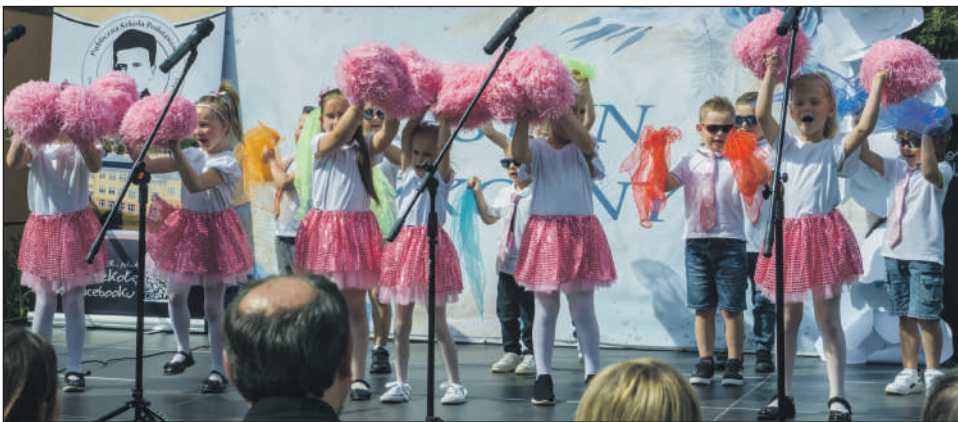
Radosny występ najmłodszych