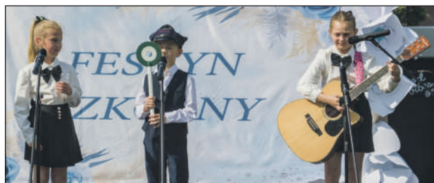
„Kolejarski” występ nagrodzony rzęsytmymi brawami