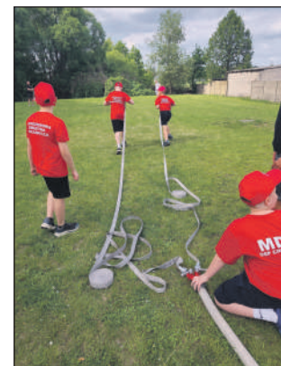
Klasyczne ćwiczenie strażackie

Wozy bojowe, wodne konkurencje i widowiskowa lekcja fizyki przyciągnęły mieszkańców na plac OSP i GOK w Chlewiskach. Tegoroczna „Majówka Strażacka” pokazała, że lokalna jednostka ma świetnych następców, a przed sobą - historyczny jubileusz.