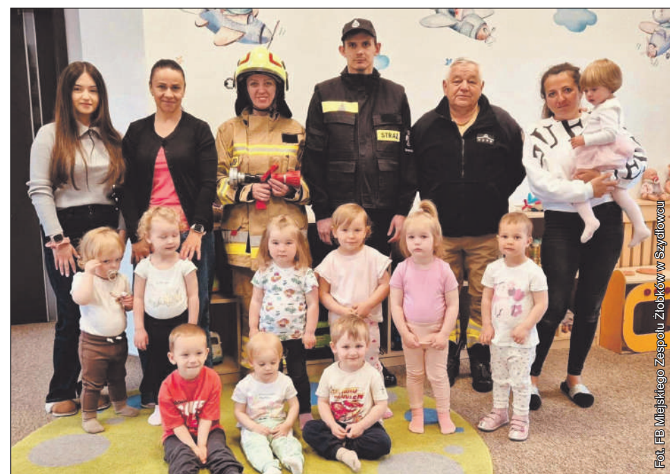
Piękne dzieci z miłymi gośćmi i wspaniałymi opiekunami.