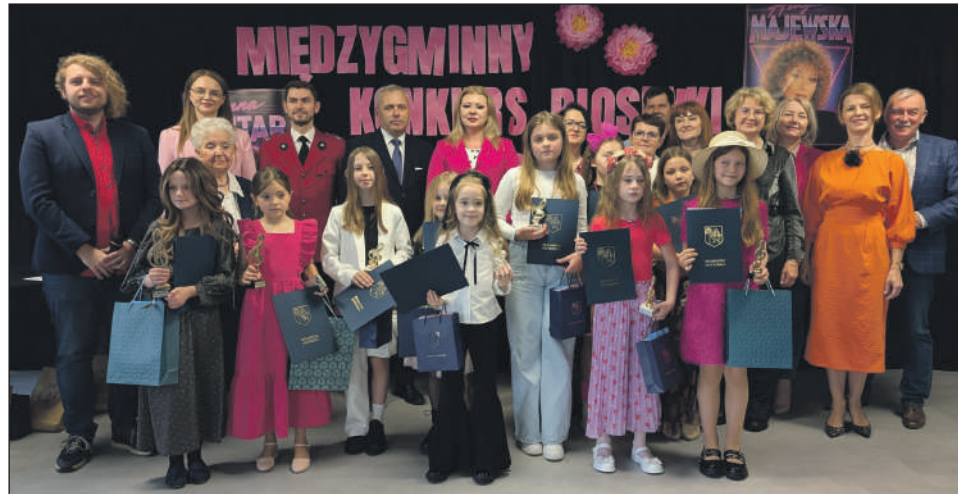
„Rodzina” fotografia z Nagrodzonymi

Po długich, pełnych emocji debatach jurorzy ogłosili oficjalne wyniki muzycznych zmagania: