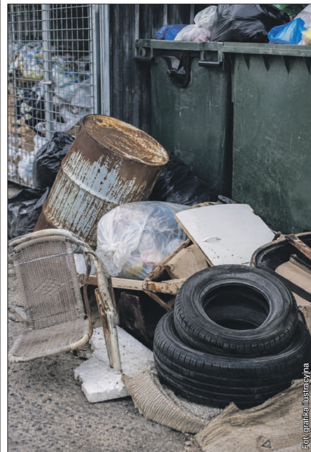
Fot. grafika ilustracyjna

Kto podrzuca śmieci pod blokami? Mieszkańcy Jachowskiego i Prusa mają dość