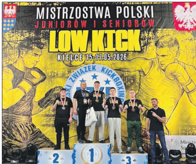
Medaliści z Victorii na odpowiednich stopniach podium w Kielcach.

To był absolutny popis siły, charakteru i mistrzowskiej formy. Reprezentanci klubu SKS KB Viktoria Szydłowiec zdominowali ringi podczas Mistrzostw Polski w Kickboxingu w formule low-kick, które odbyły się w Kielcach. Podopieczni szydłowieckiego klubu wywalczyli komplet medali, kończąc turniej ze stuprocentową skutecznością - każdy z powołanych zawodników stanął na podium!