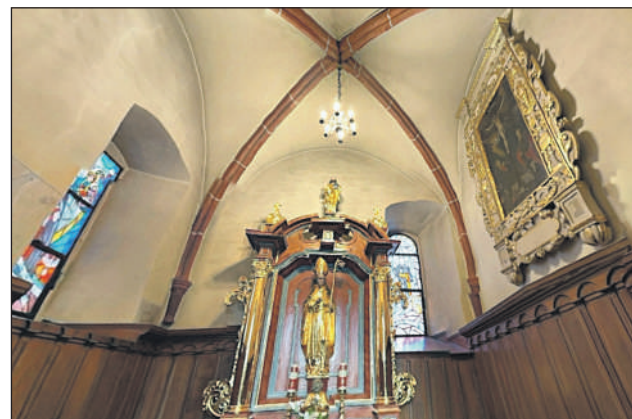
Kaplica Św. Stanisława w kościele