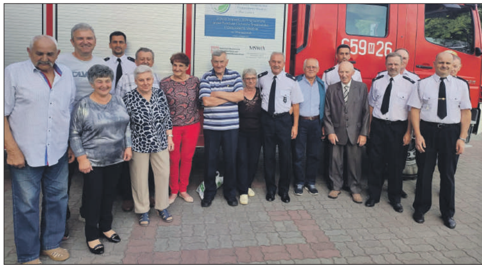
Seniorzy w pełnej krasie