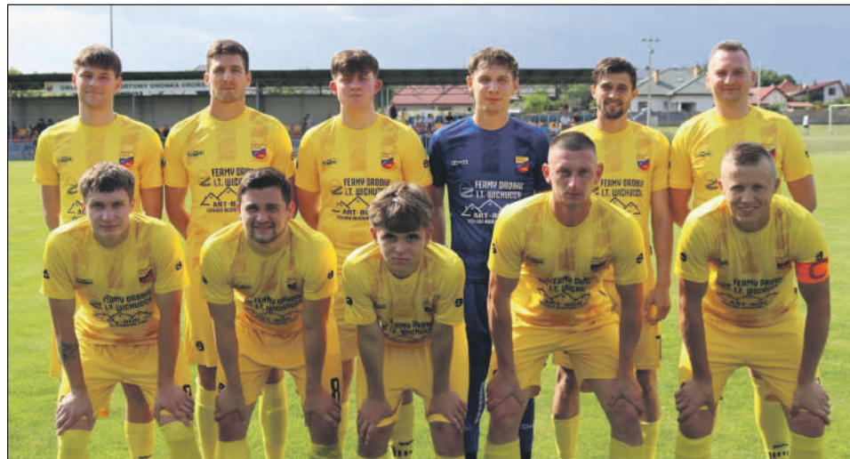
Zwycięski skład Oronki Orońsko w meczu z Zawiszą Sienno.

Sytuacja w tabeli: Dzięki tej wygranej Oronka Orońsko dopisuje bezcenne 3 punkty i ugruntowuje swoją stabilną, bezpieczną 8. pozycję w środku stawki radomskiej klasy okręgowej.