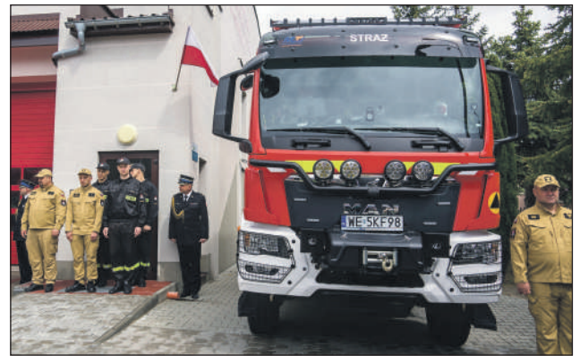
Duma z nowego samochodu bojowego

Najbardziej wyczekiwany momentem było jednak oficjalne przekazanie kluczyków do fabrycznie nowego wozu ratowniczo-gaśniczego, który zasilił