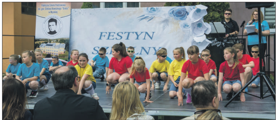
Scena dla uczniów!

Szkolne występy artystyczne, rodzinna atmosfera i wielki jubileusz w tle – tak w skrócie wyglądał festyn w Wysokiej. W wydarzeniu, które połączyło obchody 700-lecia lokalnej parafii z integracją mieszkańców, uczestniczyli nie tylko lokalni goście, ale też przedstawiciele władz powiatu.