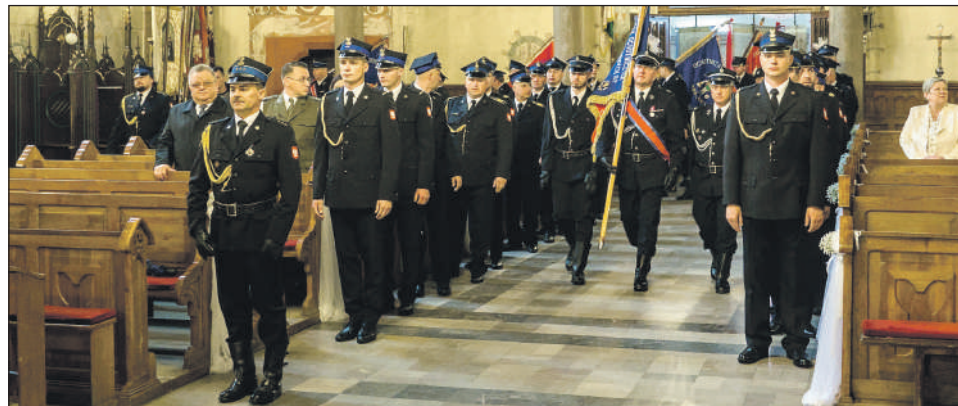
Poczty sztandarowe wchodziły do kościoła pw. Św. Zygmunta

Uroczystości rozpoczęły się tradycyjnie od mszy świętej w kościele pw. św. Zygmunta, gdzie modlono się o bezpieczne powroty z misji. Następnie strażacki ród przemaszerował na plac Komendy Powiatowej Państwowej Straży Pożarnej w Szydłowcu,