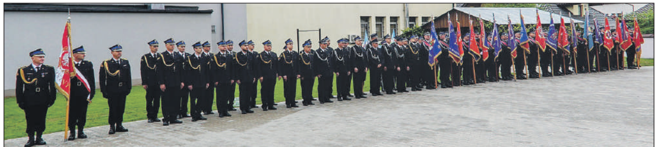
Liczne sztandary stanęły do uroczystości

Podziękowania, błyszczące ordery oraz wyjątkowy prezent w postaci nowoczesnego samochodu ratowniczo-gaśniczego – tak Szydłowiec celebrował Powiatowy Dzień Strażaka. Święto zjednoczyło zawodowców z PSP oraz druhów ochotników, którzy na co dzień dbają o nasze bezpieczeństwo.