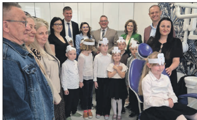
W takim gabinecie dzieci i dorośli nie boją się dentysty!

Najważniejszą informacją dla rodziców jest logistyka: z opieki stomatologicznej będą mogły korzystać wszystkie dzieci w wieku szkolnym z terenu całej gminy Orońsko. Placówka skupi się nie tylko na plombowaniu zębów, ale przede wszystkim na regularnych przeglądach i budowaniu