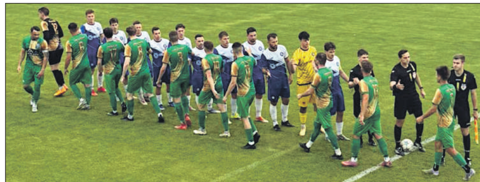
Szydłowianka podcza ostatniego w sezonie meczu z Gracją Tczów.