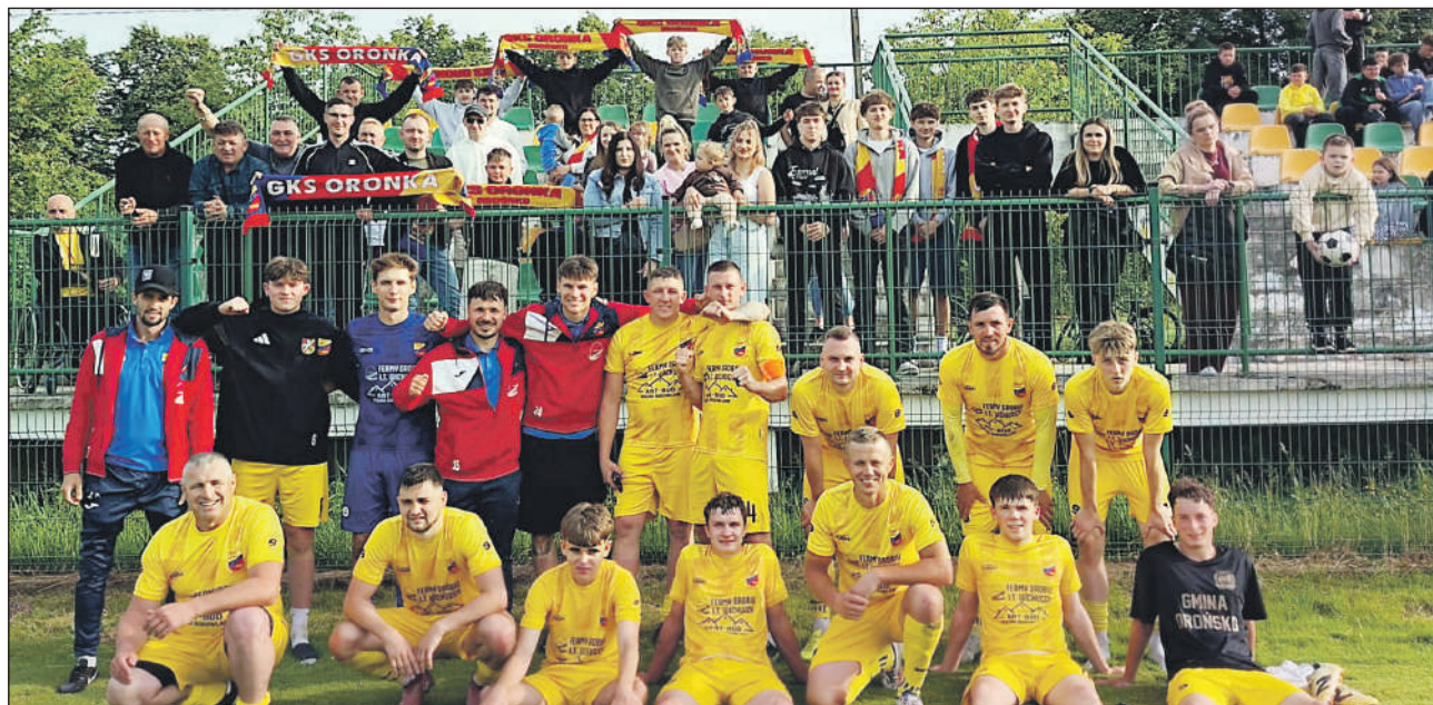
Oronka zawsze z wiernymi kibicami.

Bilans sezonu: 6 zwycięstw, 4 remisy, 16 porażek Punkty: 22 Bramki: 34:82