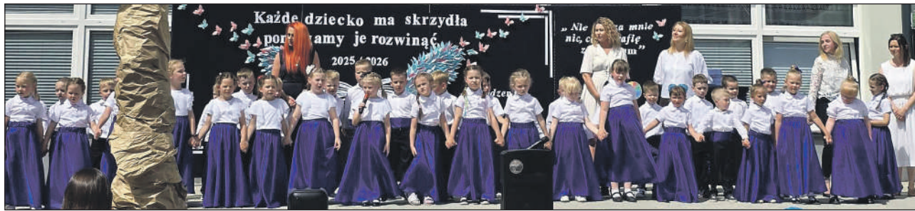
Scena zbiorowa z brawurowego występu dzieci

To był dzień pełen wzruszeń, dumy i wielkich sukcesów w Przedszkolu Samorządowym nr 2 „Mali Odkrywcy” z Oddziałami Integracyjnymi. Placówka oficjalnie pożegnała swoich tegorocznych absolwentów, którzy po wakacjach z dumą przekroczą progi szkół.