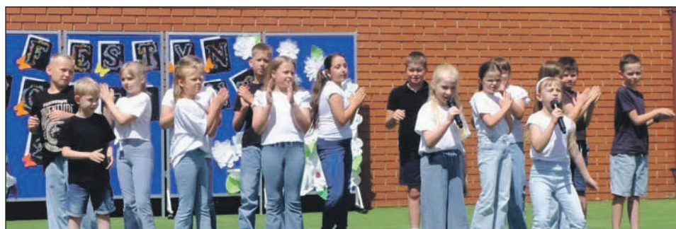
Wokalistki i cały zespół!

Po pełnych wrażeń występach i sportowych zmaganiach dzieci mogły uzupełnić siły na pysznych stoiskach gastronomicznych, gdzie czekały na nie chrupiące gofry, słodka wata cukrowa, domowe wypieki oraz uwielbiana