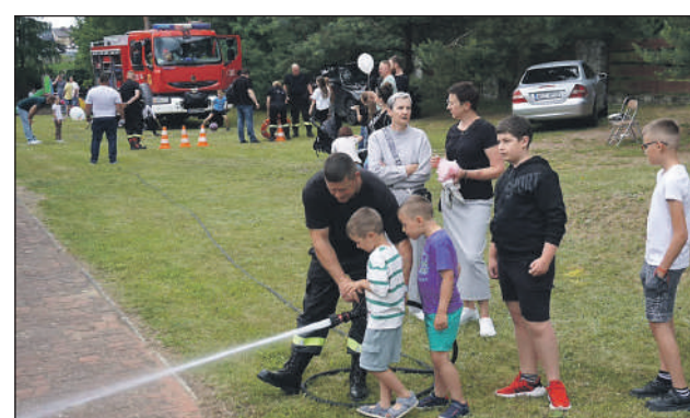
Kiedyś będziemy strażakami!

To było prawdziwe królestwo dobrej zabawy, tańca i beztroski. Teren wokół Publicznej Szkoły Podstawowej im. Tadeusza Kościuszki w Jastrzębiu zamienił się w kolorowe miasteczko rozrywki podczas dorocznego Festynu Rodzinnego.