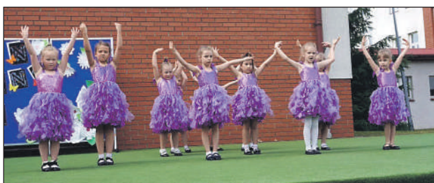
Uroda i wdzięk :)