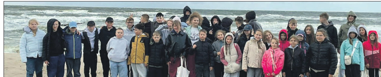
Przywitanie morza :)