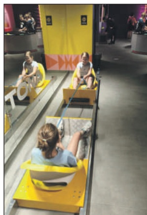
Przeciąganie liny na... siedząco

Cała ta udana, pełna pozytywnych emocji eskapada nie doszłaby do skutku, gdyby nie solidne wsparcie. Organizatorzy oraz uczestnicy składają serdeczne podziękowania Starostwu Powiatowemu w Szydłowcu, którego pomoc finansowa umożliwiła realizację tego bezpiecznego i rozwijającego wyjazdu. Wspomnienia z tej warszawskiej przygody z pewnością na długo pozostaną w pamięci młodych parafian!