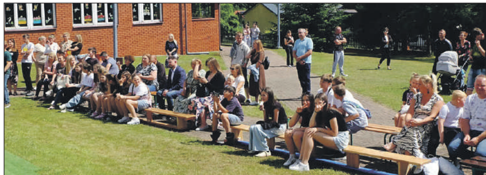
Publiczność zaczyna się gromadzić...