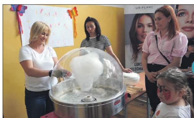
Słodko i radośnie