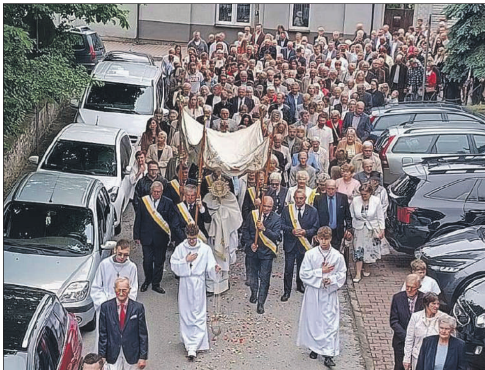
SZYDŁOWIEC. Procesja parafii pw. Świętego Zygmunta

W czwartek, 4 czerwca, we wszystkich parafiach powiatu szydłowieckiego odprawiono uroczyste procesje Bożego Ciała.