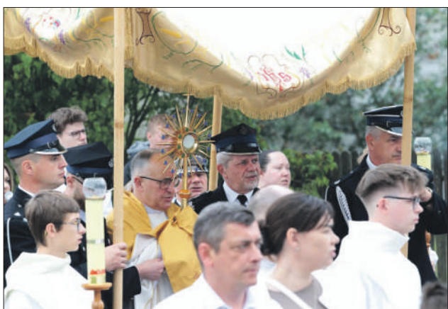
OROŃSKO. Rusza procesja z kościoła Wniebowzięcia NMP