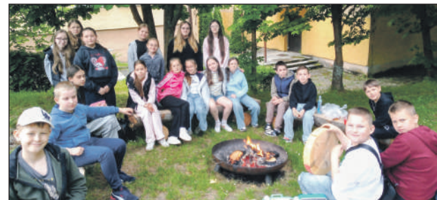
Przy ognisku jest super!

Żaden udany Dzień Dziecka nie może obejść się bez pysznego jedzenia. Cała wyprawa zakończyła się wielkim, wspólnym ogniskiem. Był czas na pieczenie kiełbasek, głośny śmiech, plotki