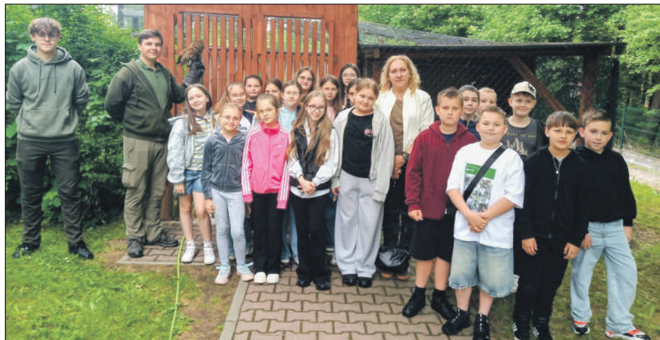
Spotkanie z sokolnikiem

Głównym punktem programu były odwiedziny u praw-