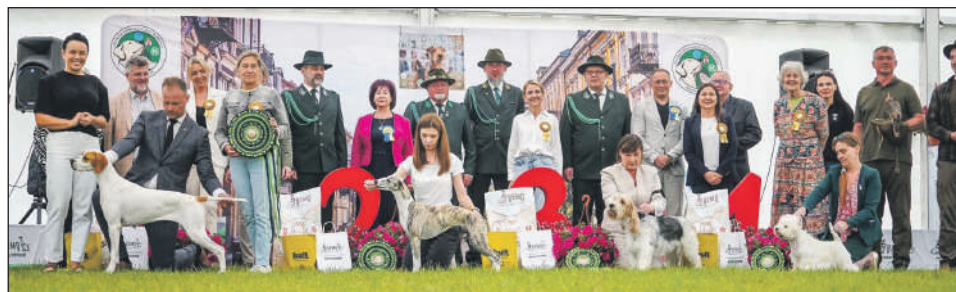
Nagrodzone psy na wystawowym „podium”

Setki wystawców, piękne czworonogi oraz liczni zwiedzający – za nami wyjątkowy weekend z III Międzynarodową Wystawą Psów Rasowych (CACIB Radom) oraz Krajową Wystawą Psów Ras Myśliwskich.