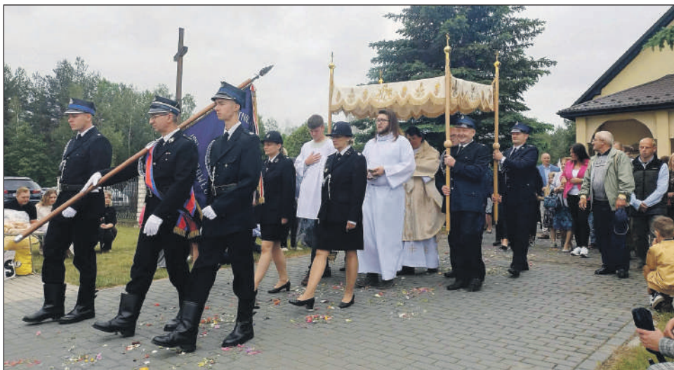
PAWŁÓW (gm. Chlewiska). Rusza procesja z kościoła pw. Świętych Apostołów Piotra i Pawła