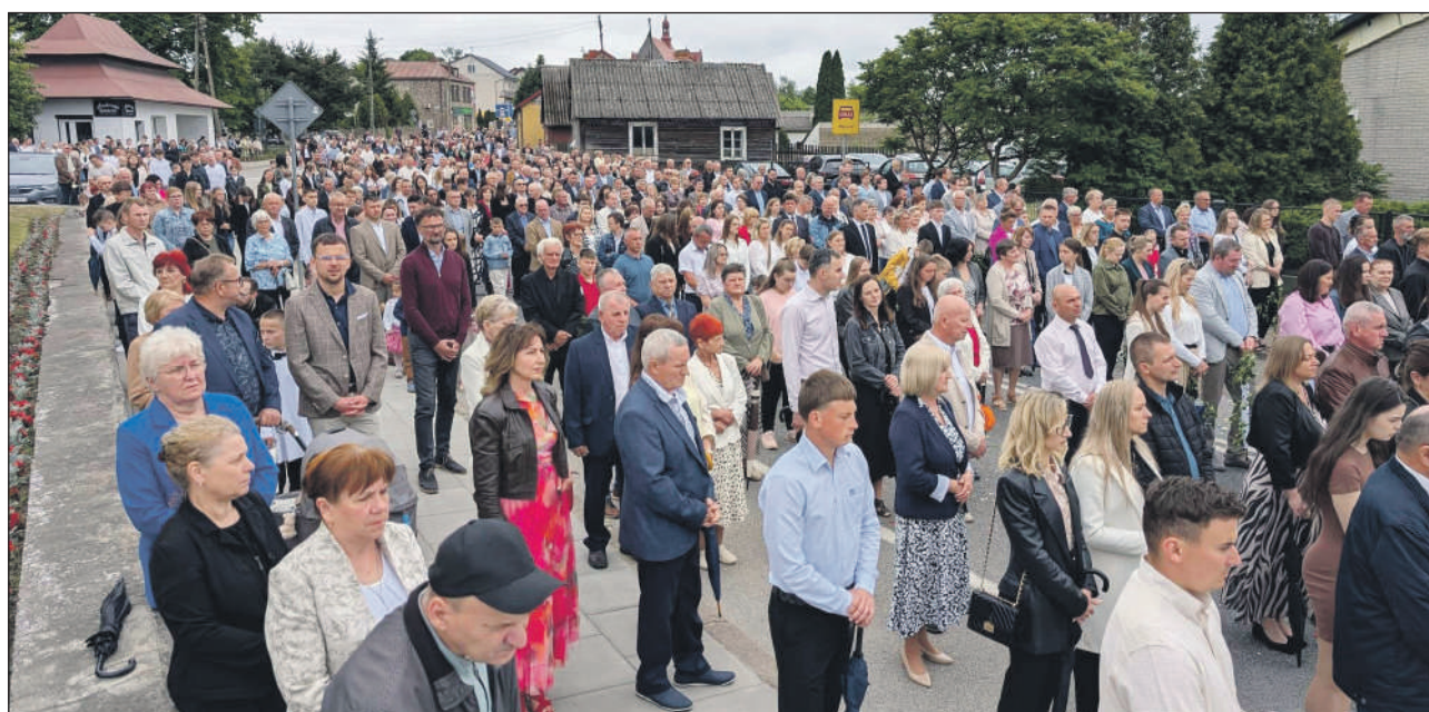
JASTRZĄB. Wierni z parafii św. Jana Chrzciciela z Jastrzębia podczas procesji