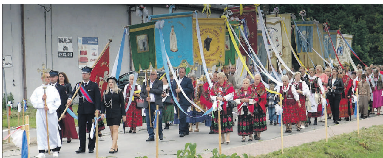
MIRÓW STARY. Parafialna procesja z kościoła pw. Matki Bożej Częstochowskiej