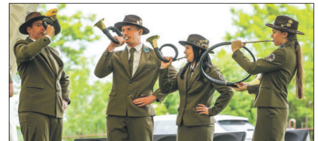
Znakomity popis Zespołu Sygnalistów Myśliwskich.

Wydarzenie zorganizowane przez ZKwP Oddział Radom